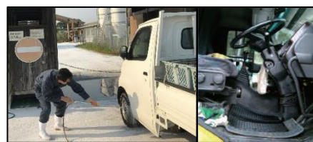
車両はタイヤだけでなく、 泥よけの内側まで消毒 し、 フロアマットの交換やペダル等車内も消毒